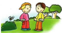
Il sè e l'altro