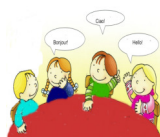
I discorsi e le parole