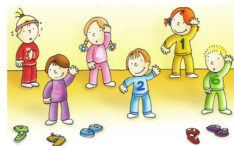
Il corpo in movimento